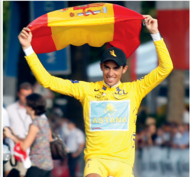
Fransa Turu'nu bir kez daha kazanıp İspanyol hakimiyetini sürdürdü.