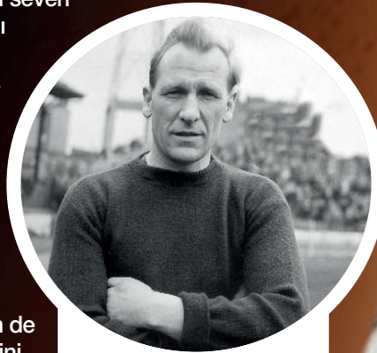
BERT TRAUTMANN (MANCHESTER CITY)

Trautmann, 1923'te Almanya'da doğdu. Spor seven atletik bir gençti. 2. Dünya Savaşı'nın başladığı dönemde otomobil tamircisi çırağı olarak çalışıyordu. 1941'den sonra Alman ordusunda 3 yıl paraşütçü olarak görev yaptı. Batı cephesinde İngilizler'e esir düştü. İngiltere'de 4 yıl kaldığı esir kampından çıkınca ülkesine döndü. Liverpool'daki günlerinde amatör maçlarda adını duyurunca 1949'da Manchester City ile anlaştı. Taraftar ise tepkiliydi. Nasıl olurdu da bir "Nazi"ye forma verilebilirdi? Hatta 20 bin kişi protesto yürüyüşü yaptı. Rakip seyircilerden de bol bol küfür yedi. Ancak kısa sürede kendisini kabul ettirdi. 1956 İngiltere Kupası finalini kırk boyunca bitirmesi onu bir kahraman yaptı. Bu sayede yılın oyuncusu ödülünü bile aldı.