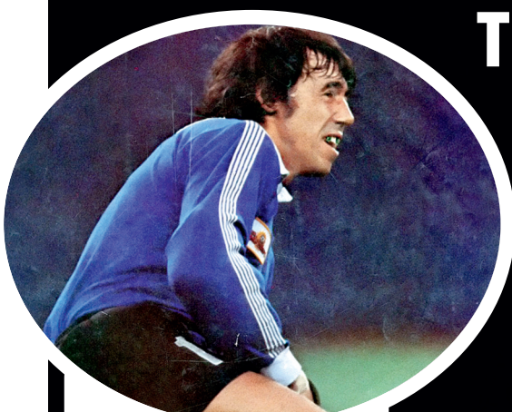
GORDON BANKS (İNGİLTERE)

İngiltere 1966'da Dünya Kupası'nı kaldırırken efsaneye dönüşen bir takımları vardı. Banks de takımın önemli isimlerindendi. Birçok spor yazarına göre İngiltere tarihinin en iyi kalecisi Banks 1966'da kurtarışlarıyla şampiyonlukta büyük pay sahibiydi. 4 yıl sonra Meksika'daki Dünya Kupası'nda yine formdaydı. Hele Brezilya maçında Pele'nin kafa vuruşunu kurtarış unutulmadı. 2 yıl sonra bir kaza kariyerini tamamen değiştirdi. Arabası şarampole yuvarlandı. Vücudunda hasar yoktu ama daha ciddi bir sorun vardı: Kafasına aldığı darbeden dolayı sağ gözü görmüyordu! Tek gözle kalecilik yapmak imkânsızdı. Futbol onu bıraktı. 1977'de bir dönüş yaptı, ABD'de Fort Lauderdale'de forma giydi.