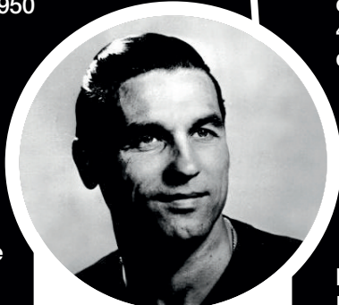
GYULA GROSICS (MACARİSTAN)

"Altın Takım" diyorlardı onlara. Puskas, Kocsis'li Macar Millî Takımı, 1950 ile 1956 arası dönemi kasıp kavuruyordu. Yaklaşık 6 yıl boyunca oynadıkları 50 millî maçta sadece tek bir yenilgi alan bu muhteşem takımın kalesini ise Gyula Grosics koruyordu. Grosics, ülkenin kuzeyinde doğdu ve futbola başladı, 1947'de 21 yaşında Macar Millî Takımı'nın kalesine geçti. 1953'ün kasım ayında İngiltere'yi, üstelik Wembley'de 6-3 yendikleri maçtan sonra ülkede kahramanlar gibi karşılandılar. Yüz binlerce Macar, ülkenin girişinden Budapeşte'ye kadar tren yolunun kenarında onlara eşlik etti. Ancak 4 yıl yenilgi yüzü görmeyen takım 1954 Dünya Kupası finalinde Almanya'ya beklenmedik şekilde mağlup olunca işler değişti. Ülkeye dönüşte oyuncular tartaklandı. Grosics'in başı daha büyük belaya girdi. Önce vatan hainliğiyle suçlanıp tutuklandı. Sonra ihbarın sahte olduğu anlaşılınca serbest bırakıldı. Yetmedi, bu kez millî takımdan uzaklaştırıldı. 1.5 yıl boyunca kadroya çağırılmadı.